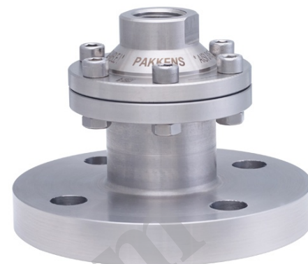
DS0520 Neck Connection Flange